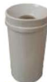
TONELETE 80 TAPA DESLIZANTE

Capacidad: 80 litros. Capacidad de carga: 32 kg. Medidas: Diámetro 39 cm, y alto 85 cm.