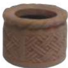
MACETA MEDIANA REDONDA TRENZADA