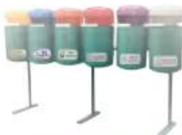
PA 30 SÉXTUPLE

Capacidad: 150 litros. Capacidad de carga: 60 kg. Medidas: Largo 195 cm, ancho 50 cm y alto 126 cm.