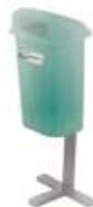
PA 50 SENCILLO

Capacidad: 50 litros. Capacidad de carga: 20 kg. Medidas: Largo 41 cm, ancho 50 cm y alto 85 cm.