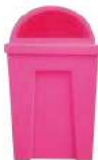
MYC TAPA DOMO

Capacidad: 90 litros. Capacidad de carga: 36 kg. Medidas: Largo 42 cm, ancho 42 cm y alto 61 cm.