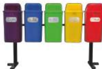
PA 50 QUÍNTUPLE

Capacidad: 200 litros. Capacidad de carga: 80 kg. Medidas: Largo 185 cm, ancho 50 cm y alto 145 cm.