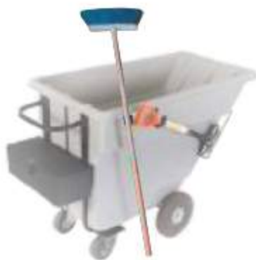
BAR INCLINABLE 500

Capacidad: 400 litros. Capacidad de carga: 160 kg. Medidas: Largo 165 cm, ancho 70 cm y alto 108 cm. No incluye accesorios.