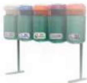
PA 30 QUÍNTUPLE

Nota: Contenedores para Residuos sólidos. La medida en litros es una referencia.