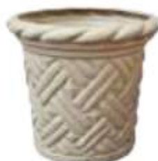
MACETA GRANDE CÓNICA TRENZADA