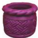
MACETA CHICA REDONDA TRENZADA

Da vida a tus espacios con las macetas de Wintech, creadas para combinar elegancia y resistencia. Su diseño innovador y calidad excepcional las convierten en el complemento perfecto para resaltar la belleza de cualquier entorno, tanto interior como exterior.