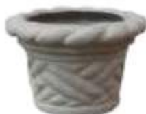
MACETA CHICA CÓNICA TRENZADA