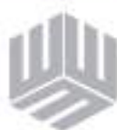
Gris Claro #B0B1B5