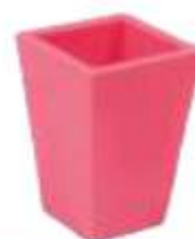
MACETA CÓNICA MINI LISA