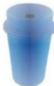
PA 145 DESLIZANTE

Capacidad: 145 litros. Capacidad de carga: 58 kg. Medidas: Diámetro 61 cm y alto 107 cm.