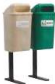
PA 50 DOBLE

Capacidad: 50 litros. Capacidad de carga: 20 kg. Medidas: Largo 41 cm, ancho 50 cm y alto 145 cm.