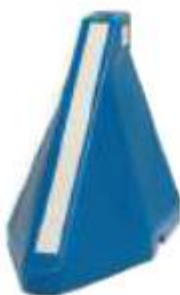
PRINCIPIO Y FIN DE OBRA

Opcional colocar reflejante. Medidas: Largo 40 cm, ancho 40 cm y alto 95 cm.