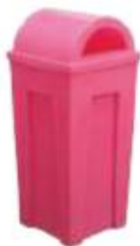
MYA TAPA DOMO

Capacidad: 120 litros. Capacidad de carga: 48 kg. Medidas: Largo 42 cm, ancho 42 cm y alto 90 cm.