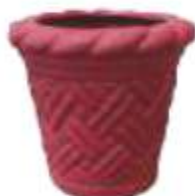
MACETA MEDIANA CÓNICA TRENZADA