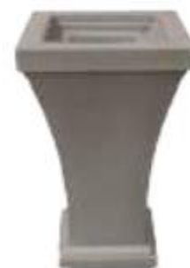
MACETA CÓNICA IMPERIAL

Medidas: Largo 40 cm, ancho 40 cm y alto 70 cm.