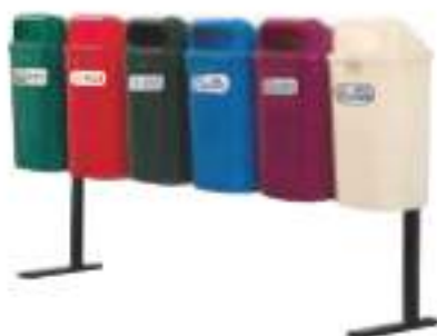
PA 50 SÉXTUPLE

Capacidad: 250 litros. Capacidad de carga: 100 kg. Medidas: Largo 232.5 cm, ancho 50 cm y alto 145 cm.