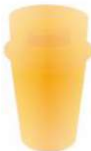
PA 145 RECTANGULAR

Capacidad: 100 litros. Capacidad de carga: 40 kg. Medidas: Largo 50 cm, ancho 50 cm y alto 100 cm.