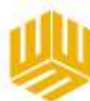
Amarillo Claro #E48337