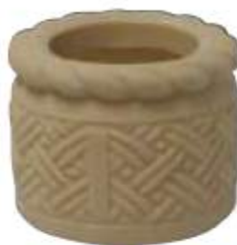
MACETA GRANDE REDONDA TRENZADA