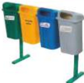
PA 50 CUÁDRUPLE

Capacidad: 150 litros. Capacidad de carga: 60 kg. Medidas: Largo 120 cm, ancho 50 cm y alto 145 cm.