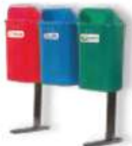
PA 50 TRIPLE

Capacidad: 100 litros. Capacidad de carga: 40 kg. Medidas: Largo 85 cm, ancho 50 cm y alto 145 cm.