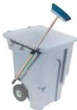
BAR VIFEL 240

Capacidad: 200 litros. Capacidad de carga: 80 kg. Medidas: Largo 126 cm, ancho 58 cm y alto 104 cm. No incluye accesorios.