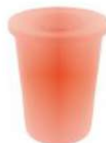
PA 145 TAPA PLANA

Capacidad: 145 litros. Capacidad de carga: 58 kg. Medidas: Diámetro 61 cm y alto 97 cm.