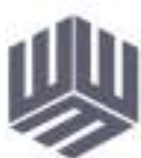
Gris Oscuro #565759